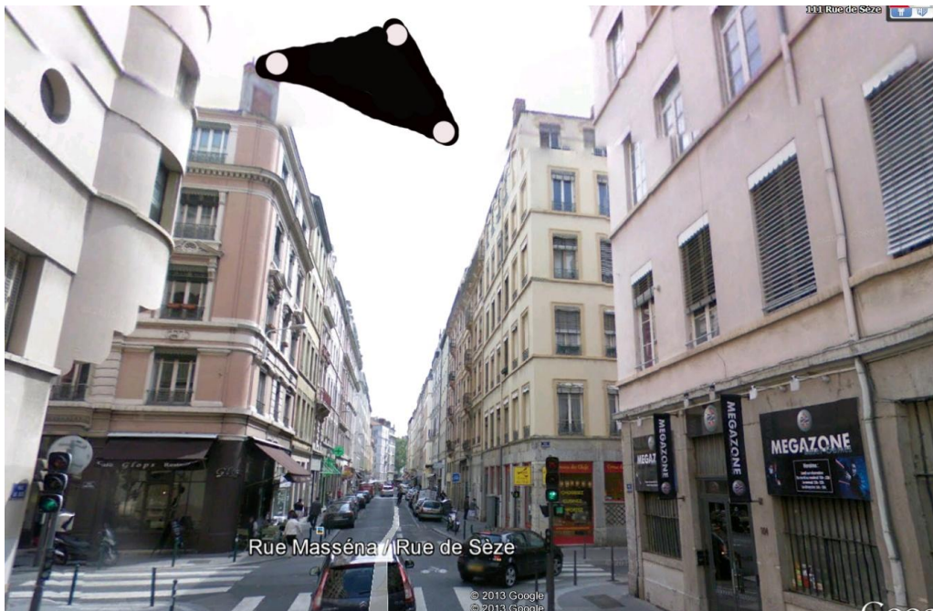
Ci-dessus : reconstitution de l'observation faite par André, le 5 juin 2013.