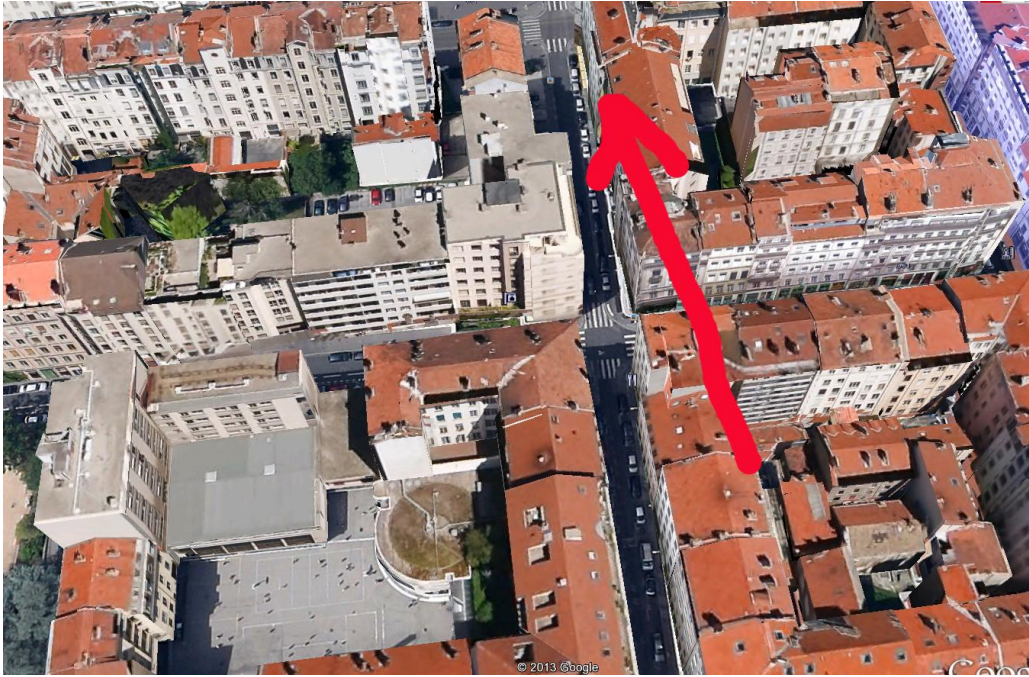
Ci-dessus : sens de déplacement du triangle noir rue de Sèze (reconstitution d'André).

L'observation faite par André ressemble dans ses grandes lignes à celle faite le 21 novembre 2008 à Vaux-en-Velin, commune située près de Lyon, vers 18h10, par M. Karnik. Dans les deux cas les témoins ont vu un grand triangle noir au-dessus d'une zone urbaine dense à très basse altitude au-dessus des immeubles.