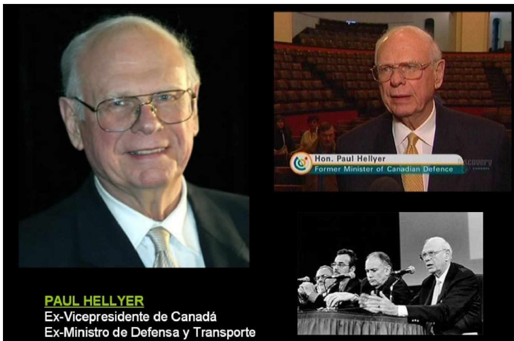
PAUL HELLYER Ex-Vicepresidente de Canadá Ex-Ministro de Defensa y Transporte